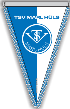
Wimpel - 28 cm -