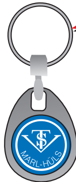
Schlüsselanhänger - Metall -