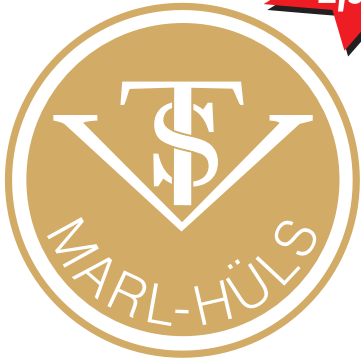
Aufkleber - transparent gold -